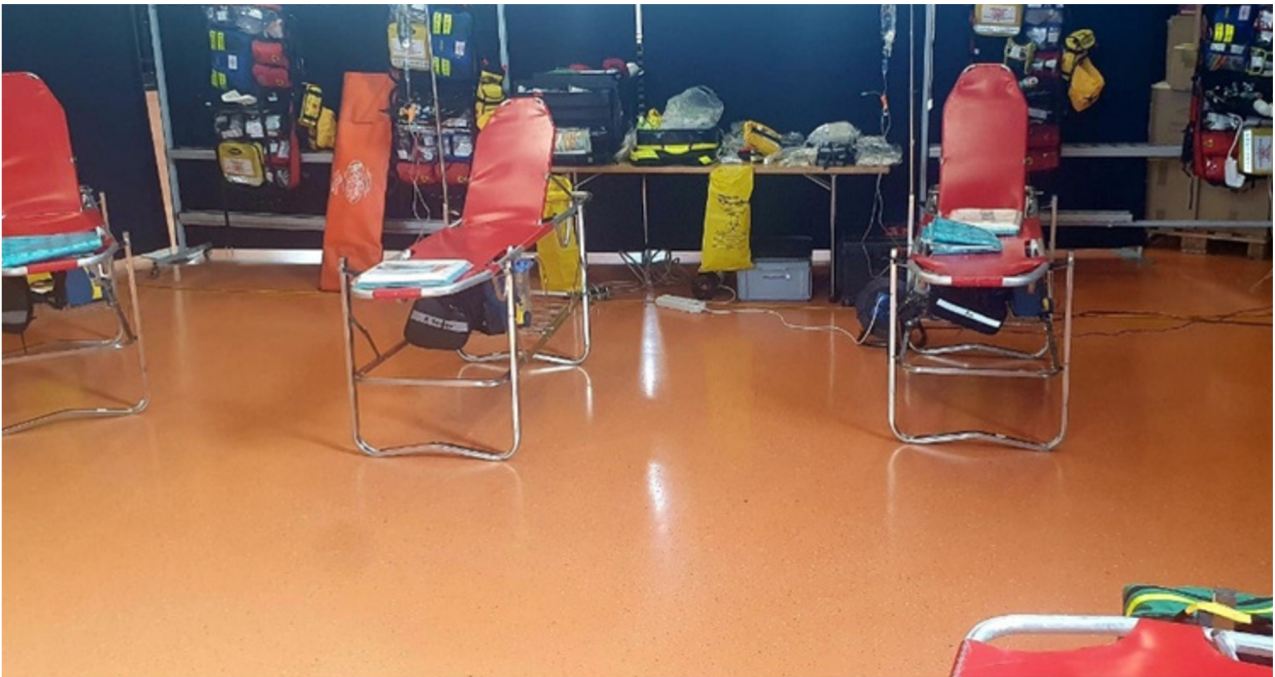
Poste médical avancé monté dans la salle des fêtes pour la grande parade du samedi

Fort de l'expérience du jeudi soir 30 avril, pour la parade du samedi, un PMA a été monté dans la salle des fêtes sur le site de la patinoire. Ce site « en dure » à proximité immédiate offrait d'excellentes conditions au GISP pour prendre en charge les personnes nécessitant des soins.